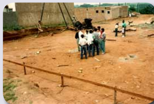
Terreno onde fica a Igreja