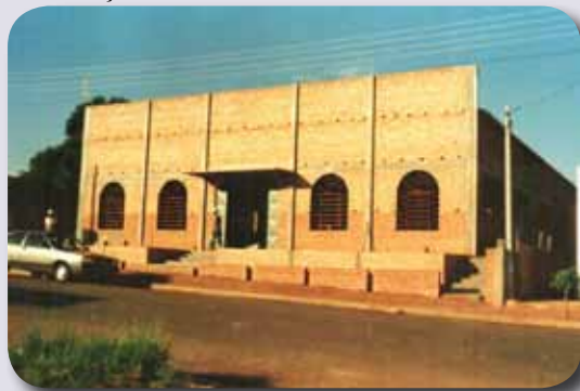
Construção da Igreja

As famílias passaram a se encontrar para as celebrações eucarísticas. As novenas, terços, encontros continuaram nas casas.