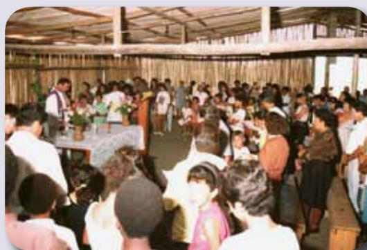
Missa na antiga Capela de Bambu