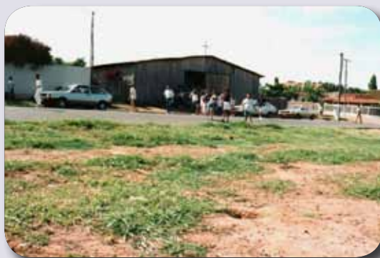
Antigo Barracão de Bambu