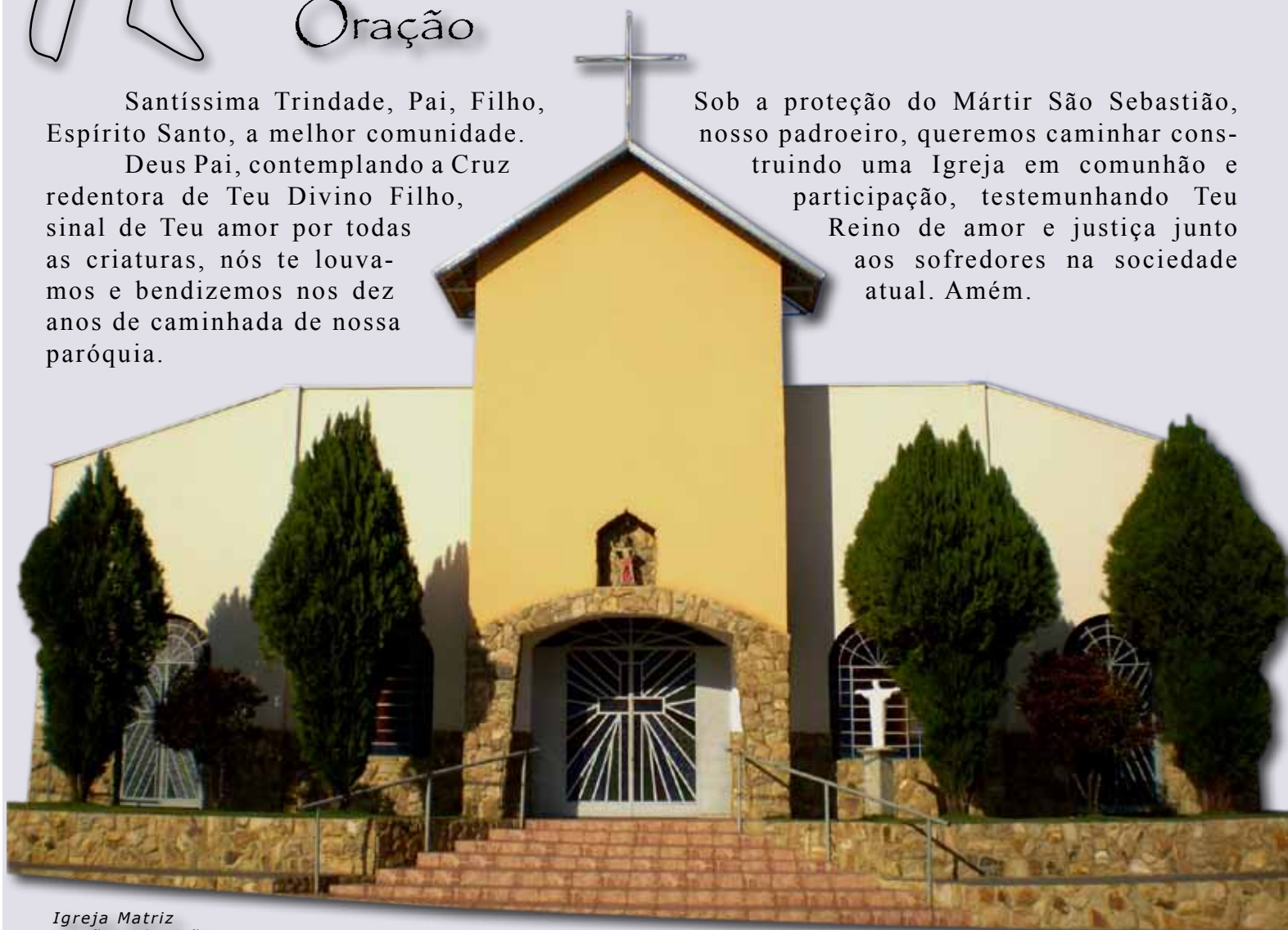
Igreja Matriz São Sebastião

Sob a proteção do Mártir São Sebastião, nosso padroeiro, queremos caminhar construindo uma Igreja em comunhão e participação, testemunhando Teu Reino de amor e justiça junto aos sofredores na sociedade atual. Amém.