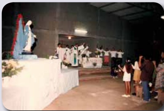
Primeira Missa na Igreja

Foi construído na frente um barracão grande coberto de zinco, fechado com folhas de zinco e bambu. Aí, por mais de cinco anos, serviu como Igreja do Bairro do Jardim Paraíso, onde a comunidade se reunia para os atos religiosos e festivos.