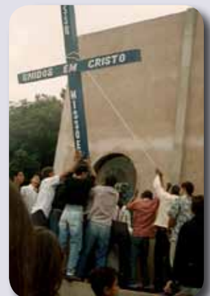
Missões de 1995

Como diz o Salmo 126, Deus transforma o sofrimento em alegrias, quando agem com retidão de coração. “Se o Senhor não construir a casa, em vão trabalham os que a constroem; se o Senhor não guarda a cidade, em vão vigiam os sentinelas.”